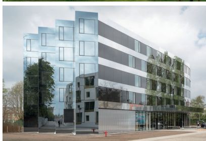
Foto's 1 & 3 © Frans Parthesius, XDGA Foto's 2 & 4 © Matthias Van Rossen, XDGA